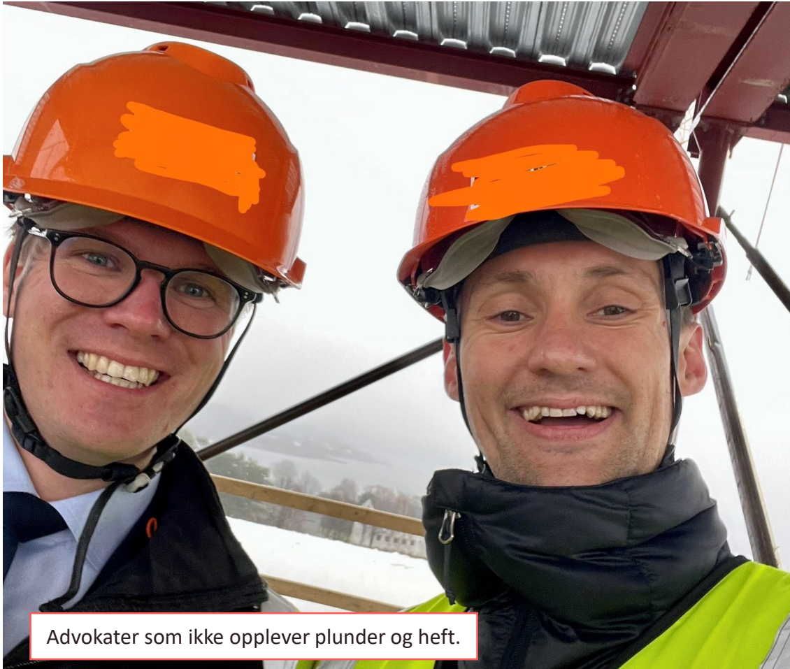
Advokater som ikke opplever plunder og heft.